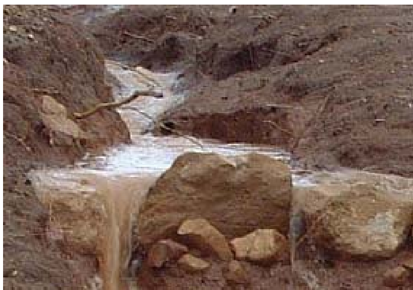
Las hierbas contribuyen a reducir la erosión del suelo por efecto del agua

Ahora bien, una pregunta que nos podemos hacer es: ¿las malas hierbas, son malas siempre, cualquiera que sea la cantidad y el momento en que las encontremos en nuestra finca? ¿Realizan alguna labor positiva que nos beneficie como agricultores? En el siguiente apartado vamos a tratar de responder a estas preguntas.